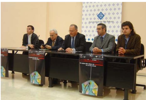
Foto del moment en què l'organització va inaugurar el Curs

Al curs hi hagué gairebé dos-cents matriculats, però l'assistència fou encara més elevada. En aquest curs, que es féu a la sala d'actes de Son Lledó el divendres i al Centre de Cultura Sa Nostra, a Palma, participaren destacats ponents.